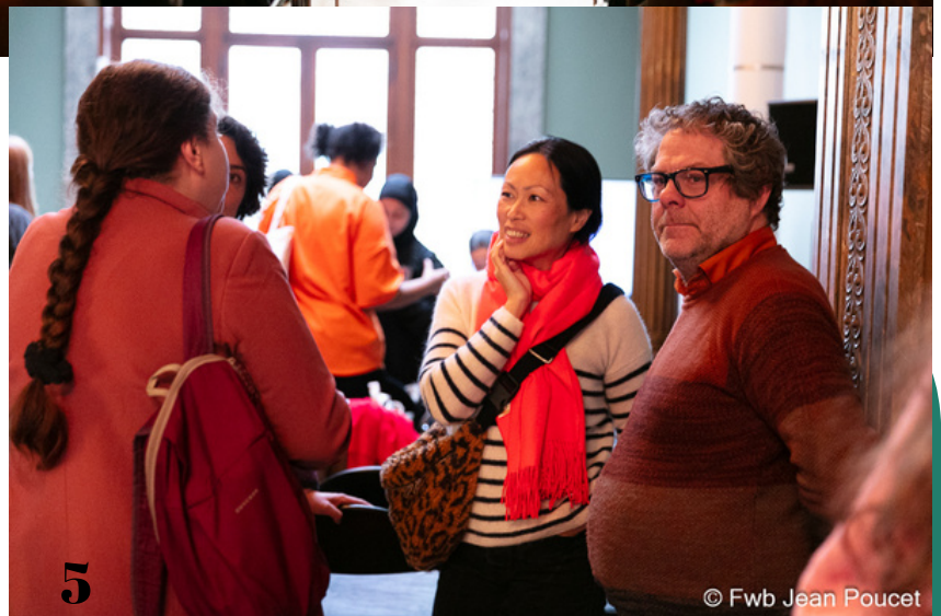
1- Les sérigraphies de la MJ La Clef 2- Un calligramme de l'OJ REFORM 3- Discours de la direction du Service Jeunesse 4- Discours de la direction de la Langue Française 5- Public et intervenants artistiques lors de la journée du 20 mars 2024